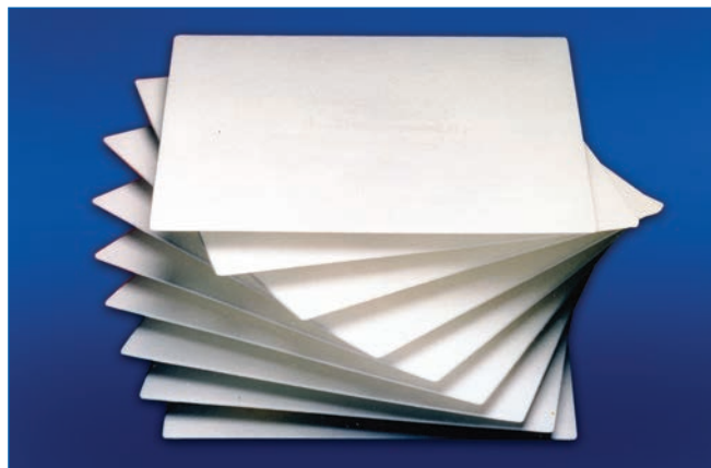
Plaques filtrantes Seitz série K