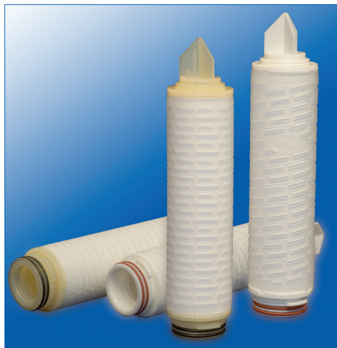
Cartouches filtrantes Ultipor N66 dotées d'une structure en polyester